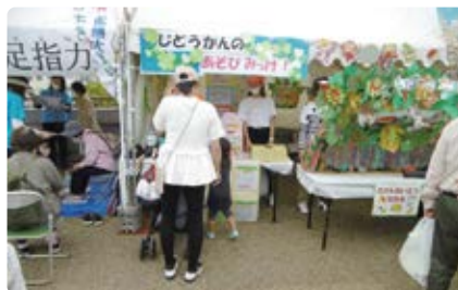
児童館の遊びのブース