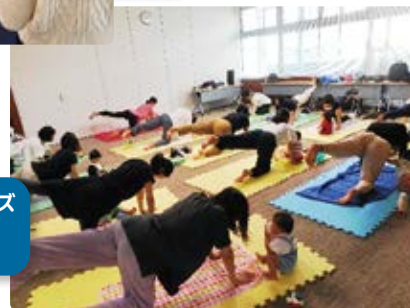
エクササイズ & ヨガ