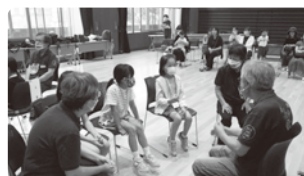
<講師>兵庫区聴力言語障害者福祉協会 手話通訳グループ 暁の会