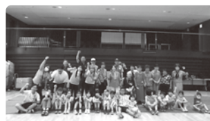
<講師>兵庫県モルック協会 <協力>兵庫区福祉団体連合会・ハートサロ