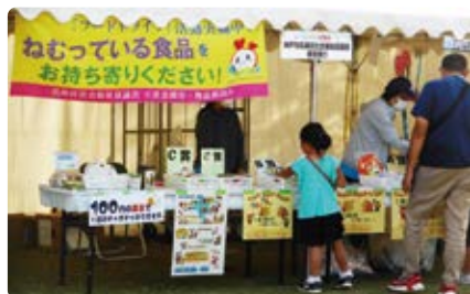
ガチャガチャ募金・フードドライブ

こういった大きなイベントに私たち社会福祉協議会や福祉団体が出店することで、少しでも福祉に関心を持ってもらえる方、応援していただける方を増やしていきたいと思っております！