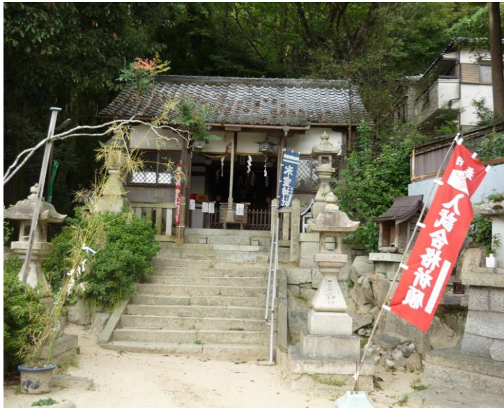
《 本殿 》